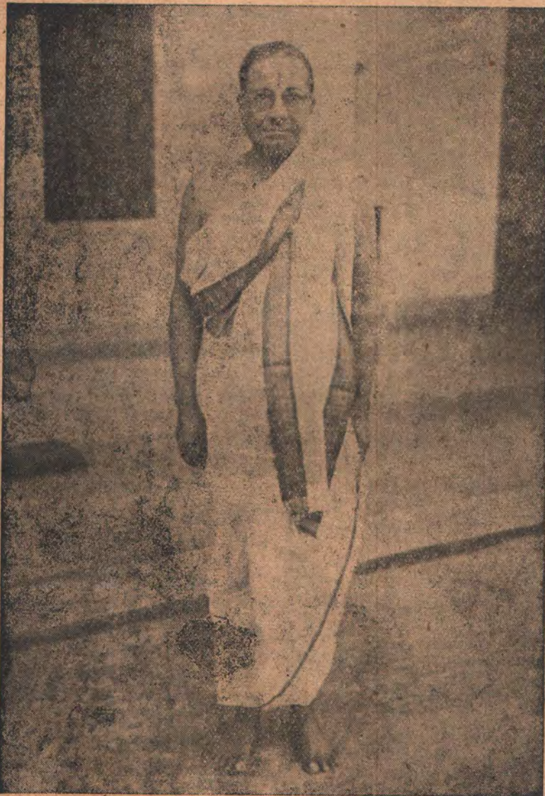
ஸ்ரீமதுபயவே டாக்டர் ஸர். K. S. கிருஷ்ணன், F.R.S. “பத்மவிபூஷண” புதுடிவில்

கீழே மூன்றும் பகுதியில் (பக்கம் 159ல்)—“ அடியேனுடைய வாழ்க்கையில்